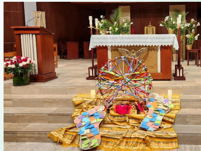
Imágenes: Retiro de Justicia Social organizado por la Oficina del Ministerio Hispano de la Arquidiócesis de San Paul & Minneapolis (Utilizadas con permiso)