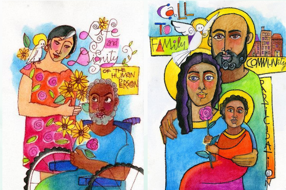
Imágenes: Brother Mickey McGrath, OSFS (Utilizadas con permiso)