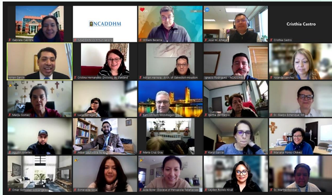
Imagen: Asociación Nacional Católica de Directores Diocesanos para el Ministerio Hispano/Departamento de Justicia, Paz y Desarrollo Humano, Conferencia de Obispos Católicos de los Estados Unidos